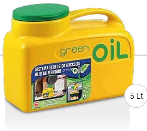
greenOIL | greenOIL