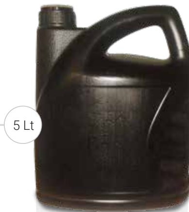
FOR ENGINE OIL WITH VIEW STRIPE | PER OLIO MOTORE CON VIEW STRIPE

Tanica per il recupero dell'olio alimentare e di frittura con bocchettone antiunto e sistema di filtraggio brevettato. Tappo di chiusura a scatto.